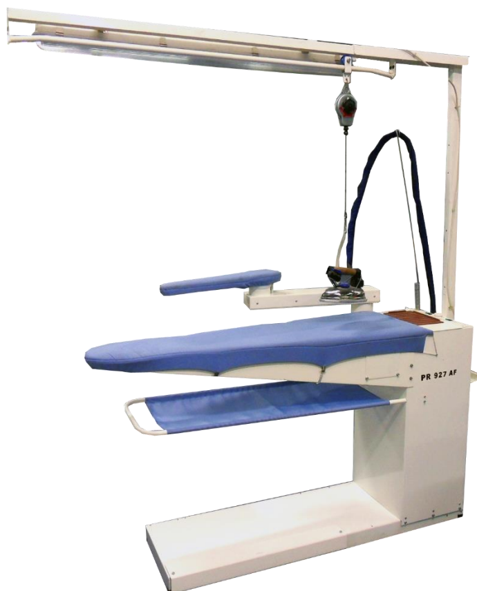
TABLE DE REPASSAGE